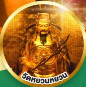
วัดหยวนหยวน ขอพรเรื่องสุขภาพ, โชคลาภ ความเจริญก้าวหน้า

เมนูพิเศษ! ต้มช้ำฮ่องกง, บุฟเฟ่ต์ซาบูสโตลฮ่องกง, ห่านย่าง