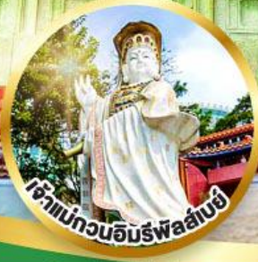
เจ้าแม่กวนอิมรั้งอัมมีย์ ขอพรรับพลังงานดี เสริมพลังดวงคู่