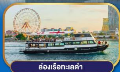
ล่องเรือทะเลดำ