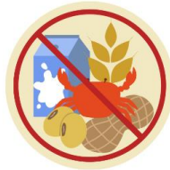
● แพ้อาหาร / อื่นๆโปรดระบุ