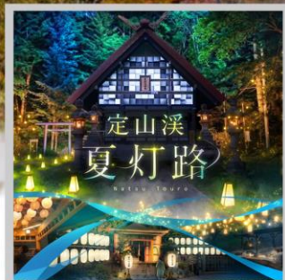
“JOZANKEI NATSU TOURO 2026”