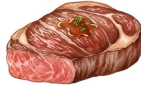
● ไก่ทานเนื้อหมู