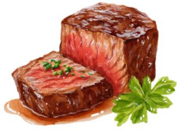
● ไก่ทานเนื้อวัว

ขอความกรุณาแจ้งวัตถุดิบที่ท่านแพ้หรือไม่สามารถรับประทานได้