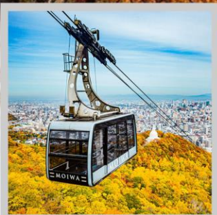
“MT. MOIWA ROPEWAY”