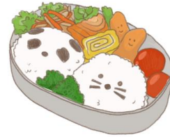
● อาหารสำหรับเด็ก ( 2-11 ปี ) *วัตถุดิบขึ้นอยู่กับทาว์ราน