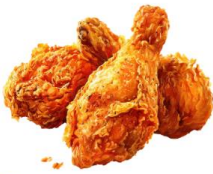
● ไก่ทานสัตว์ปีก (ไก่)