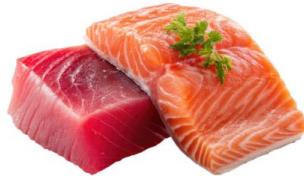
● ไก่ทานปลาดิบ