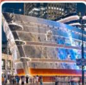
เรือหุหลู่