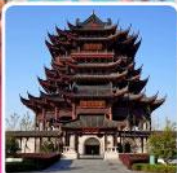
วัดฉงหววน