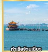
ท่าเรือเจ้านเฉียว