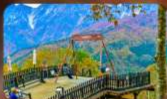
ฮาคุบะ-อิวาซากะ