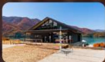
AO Lakeside Cafe 1

HOTEL NARITA AREA หรือเทียบเท่ามาตรฐานญี่ปุ่น