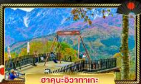
ฮาคุบะอิวากาตะ