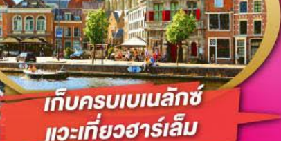
เก็บครบเบเนลักซ์ แวะเที่ยวฮาร์เล็ม