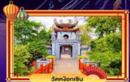
วัดน็อกอิน