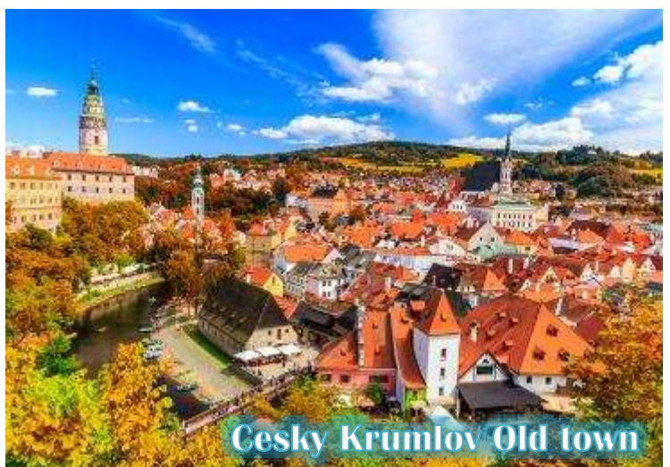
Cesky Krumlov Old town

บ่าย นำท่านเดินทางสู่ “เมืองเชสกี้ คุมลอฟ (เมืองมรดกโลก)” เป็นเมืองขนาดเล็กในภูมิภาคโบฮีเมียใต้ของ สาธารณรัฐเช็กมีชื่อเสียงจากสถาปัตยกรรม และศิลปะของเขตเมืองเก่าและปราสาทคุม ลอฟ ที่ยังคงมีเสน่ห์เหมือนอยู่ในเทพนิยายมา จนถึงทุกวันนี้ และน่าจะเป็นเมืองที่สวยงามที่สุดใน สาธารณรัฐเช็ก, เชสกี้ คุมลอฟได้รับการจัด อันดับให้อยู่ในสิบเมืองที่สวยงามที่สุดในโลก เป็น หนึ่งในสถานที่ที่สวยงามที่สุดและไม่ควรพลาด ในการเดินทางไปสาธารณรัฐเช็ก เดินเล่นไปบน ถนนในยุคกลาง ปราสาทสไตล์บาโรกที่ไม่บุบ สลาย และแม่น้ำที่คดเคี้ยว เมืองเก่าที่งดงามแห่งนี้ได้รับการอนุรักษ์ไว้เป็นอย่างดีจากอดีตและการทิ้งระเบิดใน สงครามโลกครั้งที่ 2 ทั้งหมดทำให้เมืองที่มีทิวทัศน์แห่งนี้รู้สึกเหมือนอยู่ในเทพนิยายจากยุคกลางสู่ความเป็นจริง