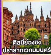
คิสบียังฉิง ปราสาทเวทมนตร์