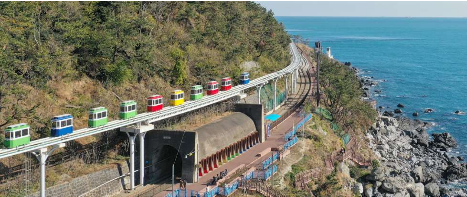
โดยเฉพาะช่วงเย็นที่พระอาทิตย์ตกดิน จะเห็นวิวที่โรแมนติกเป็นอย่างมาก

แวะเดินเล่น ถนนหาดแฮอนแด หนึ่งในชายหาดที่สวยงามและมีชื่อเสียงที่สุด ตั้งอยู่ใจกลางเมืองปูซาน ด้วยหาดทรายขาวละเอียด ทะเลสีครามใส และวิวเมืองที่สวยงาม ทำให้หาดแฮอนแดเป็นจุดหมายปลายทางยอดนิยมของนักท่องเที่ยวทั้งชาวเกาหลีและชาวต่างชาติ จากชายหาดสามารถมองเห็นตึกระฟ้าและวิวเมืองปูซานได้อย่างชัดเจน