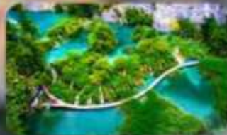
อุทยานแห่งชาติพลีทวิเซ่