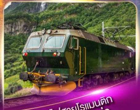
รถไฟสายโรเมนติก ฟลิมส์บาน่า