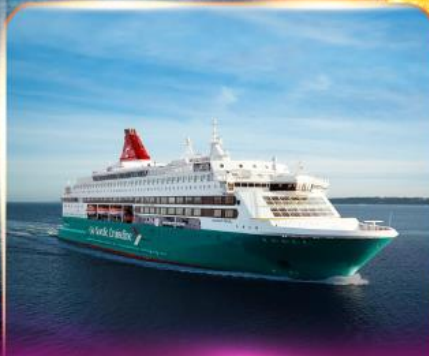
เรือสำราญ GO NORDIC CRUISE LINE