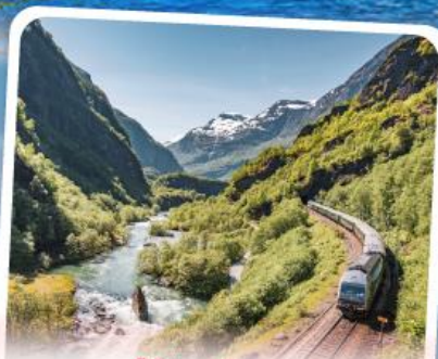
พหลิมส์บานา รถไฟเส้นทางสายโรแมนติก